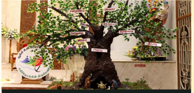
கடவுளின் கனிகள் என்ற மையக்கருத்தினை வெளிப்படுத்தும் வகையில், இளைஞர்களால் வடிவமைக்கப்பட்ட குடில்.