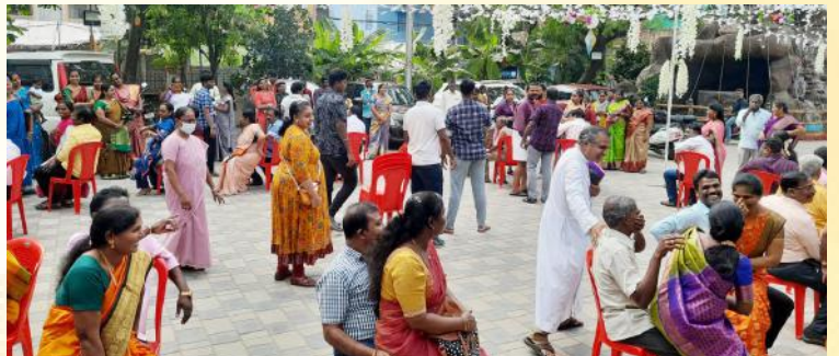
திருக்குடும்ப விழாவை சிறப்பிக்கும் வகையில் தம்பதியினருக்கு விளையாட்டுப் போட்டிகள் நடைபெற்றன.