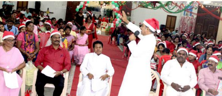
கிறிஸ்து பிறப்பு விழாவை முன்னிட்டு பங்குத்தந்தை அனைவருக்கும் ஆசி வழங்கினார்.