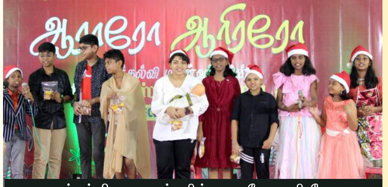
மறைக்கல்வி மாணவர்களின் ஆராரோ ஆரிாரோ கிறிஸ்து பிறப்பு விழா நிகழ்வு. (05.11.2023)