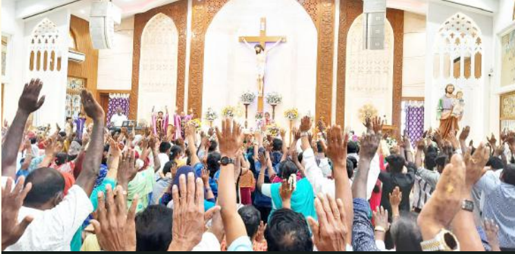
திருவருகைக்கால தியானம். (08,09,10.12.2023)