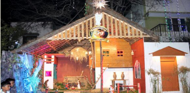
பங்கு வளாகத்தில் சிறப்பாக அமைக்கப்பட்ட குடில்.