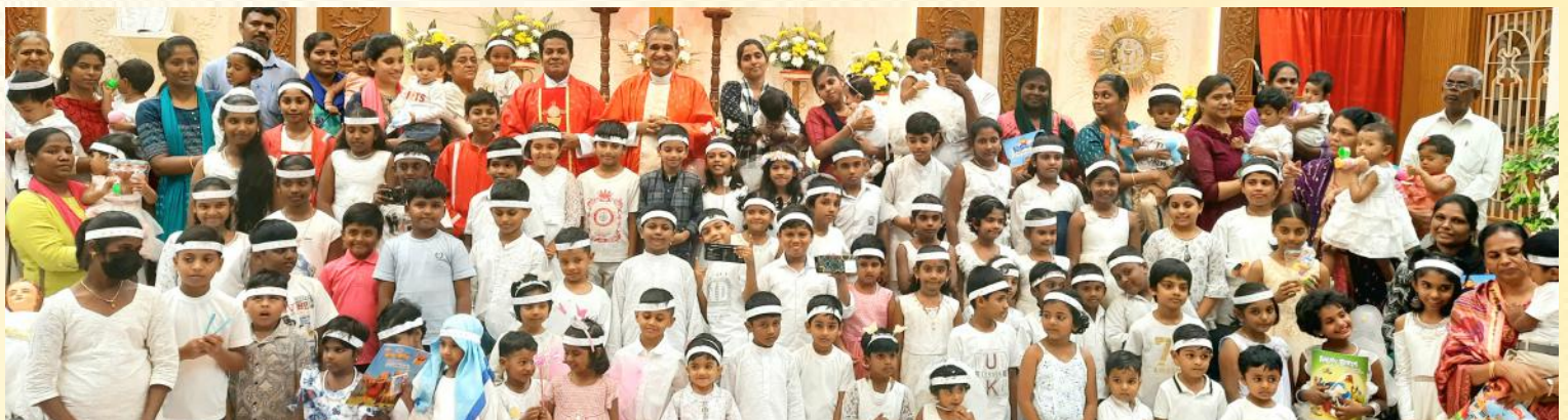
மாசில்லாக் குழுந்தைகள் நாளை சிறப்பிக்கும் முகமாக நமது பங்கின் மாசில்லாக் குழுந்தைகள். (28.12.2023)